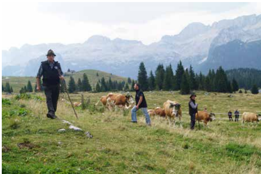
Zbiranje živine pred odgonom, Planina Pecol pod Montažem