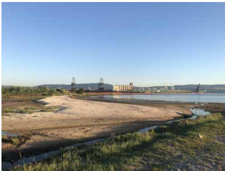
Ob izlivu reke Rižane

manj poveden. Tu je reka namreč (spet) nastopila kot tista, ki je ni na spregled, a tudi kot tista, ki pušča namige o svojem veččasovnem obstoju – zamočvirjena delta, preprejena z infrastrukturnimi posegi, in nad njo Sermin, prazgodovinska in zgodnjericimska naselbina, nekoč oblita z Rižano. Drugi dan je bil »klasično« terenski – ogled točk in pogovori. Ob slednjih smo lahko primerjale svoje vtise prejšnjega dne z mnenji sogovornikov; npr. naše vprašanje, kje da je Rižana , se je zazdelo drugi dan, v okolici Dekanov, kjer je reka najbolj »rečna« in vidna, na mestu, kjer želi lokalna iniciativa postaviti sprehajalne poti in kjer sledeč sogovornici včasih zaradi šumenja vode ni moč zaspati, skorajda nesmiselno. Svoje izkušnje smo nadalje premislile s pisanjem raziskovalnih esejev. Besedilo ni bilo mišljeno za objavo, kot tudi ni bilo del klasičnega terenskega zapisa ali dnevnika, saj je bilo namenjeno debati med raziskovalkami oziroma kot nekakšen vmesni korak med terenskim zapiskom in objavljenim tekstom. V drugem koraku smo eseje podelile na diskusijski delavnici.