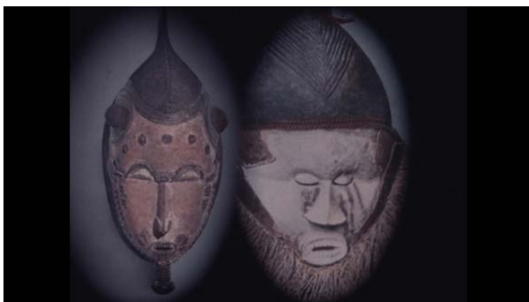
Fotograma iz filma z delovnim naslovom Afriške maske