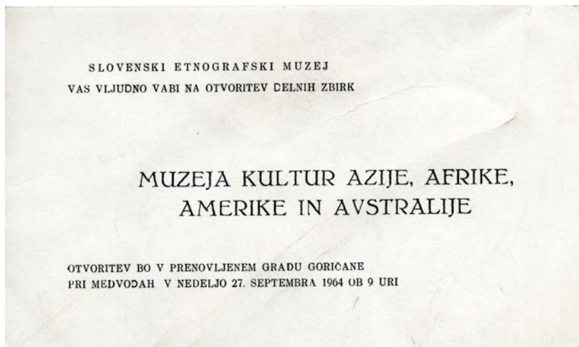
Prvo povabilo v Muzej kultur Azije, Afrike, Amerike in Avstralije