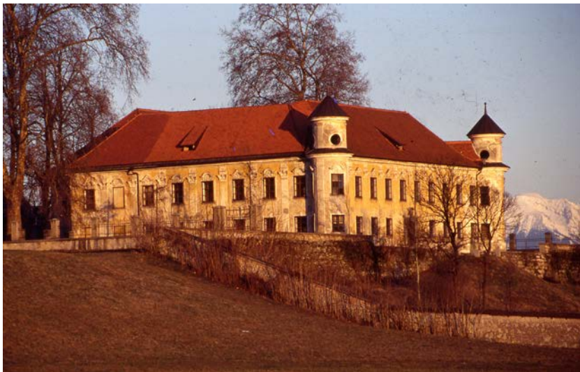
Muzej neevropskih kultur v dvorcu Goričane, Goričane pri Medvodah, 1997

Muzej Goričane je v naslednjih desetletjih predstavljal kulture Azije, Afrike, Amerike in Avstralije ter v obdobju, ko potovanja še niso bila tako razširjena kot danes, svetovnega spleta pa še niso iznašli, mnogim obiskovalcem predstavljal okno v svet. Uradno je deloval do leta 2001, ko so bile zunajevropske zbirke preseljene v depo v Škofjo Loko in potem v matični muzej, ki se je leta 1997 preselil na Metelkovo ulico 2. Ob 60-letnici vzpostavitve muzeja smo zaradi njegovega velikega pomena v šestdesetih, sedemdesetih in osemdesetih letih 20. stoletja v SEM pripravili filmski program z obujanjem spominov na razstave, spremljevalne dejavnosti in glavne akterje muzeja v Goričanah. Vzporedni motiv je bil, da obenem pridobimo tudi nove vpoglede v goričansko obdobje, ki še ni dovolj raziskano. Uro pred začetkom filmskega večera so si obiskovalci lahko ogledali občasno razstavo Azija sredi Ljubljane: Življenje Skuškovske zbirke , po kateri je vodila ena od avtoric, dr. Helena Motoh iz Znanstvenoraziskovalnega središča Koper (glej članek o tej razstavi v naslednjem razdelku na straneh 195–200).